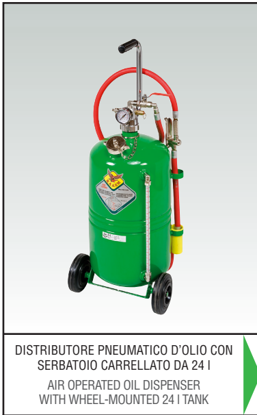
DISTRIBUTORE PNEUMATICO D'OLIO CON SERBATOIO CARRELLATO DA 24 l AIR OPERATED OIL DISPENSER WITH WHEEL-MOUNTED 24 l TANK