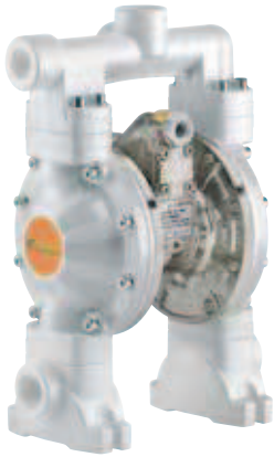
POMPA A MEMBRANA SERIE 1/2" 120-PB DOPPIA ENTRATA DIAPHRAGM PUMP SERIES 1/2" 120-PB DOUBLE INLET