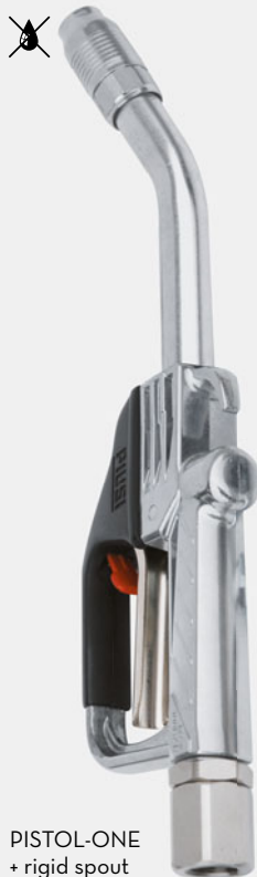
PISTOL-ONE + rigid spout