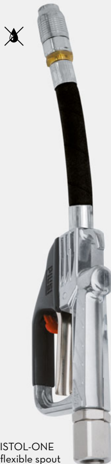
PISTOL-ONE + flexible spout