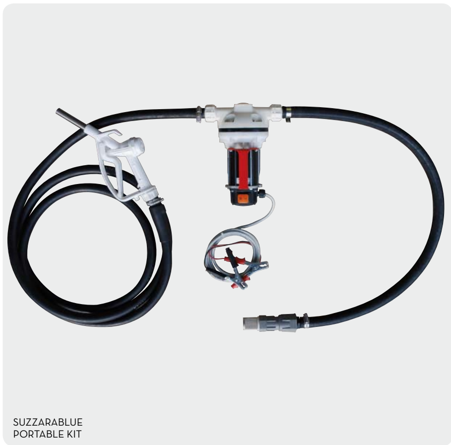
SUZZARABLU PORTABLE KIT