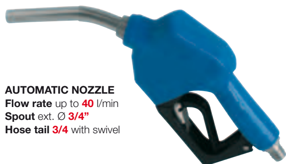
AUTOMATIC NOZZLE Flow rate up to 40 l/min Spout ext. Ø 3/4" Hose tail 3/4 with swivel