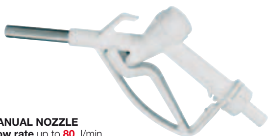
MANUAL NOZZLE Flow rate up to 80 l/min Spout ext. Ø 3/4" Hose tail 3/4