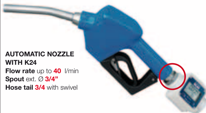
AUTOMATIC NOZZLE WITH K24 Flow rate up to 40 l/min Spout ext. Ø 3/4" Hose tail 3/4 with swivel