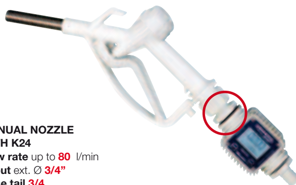
MANUAL NOZZLE WITH K24 Flow rate up to 80 l/min Spout ext. Ø 3/4" Hose tail 3/4